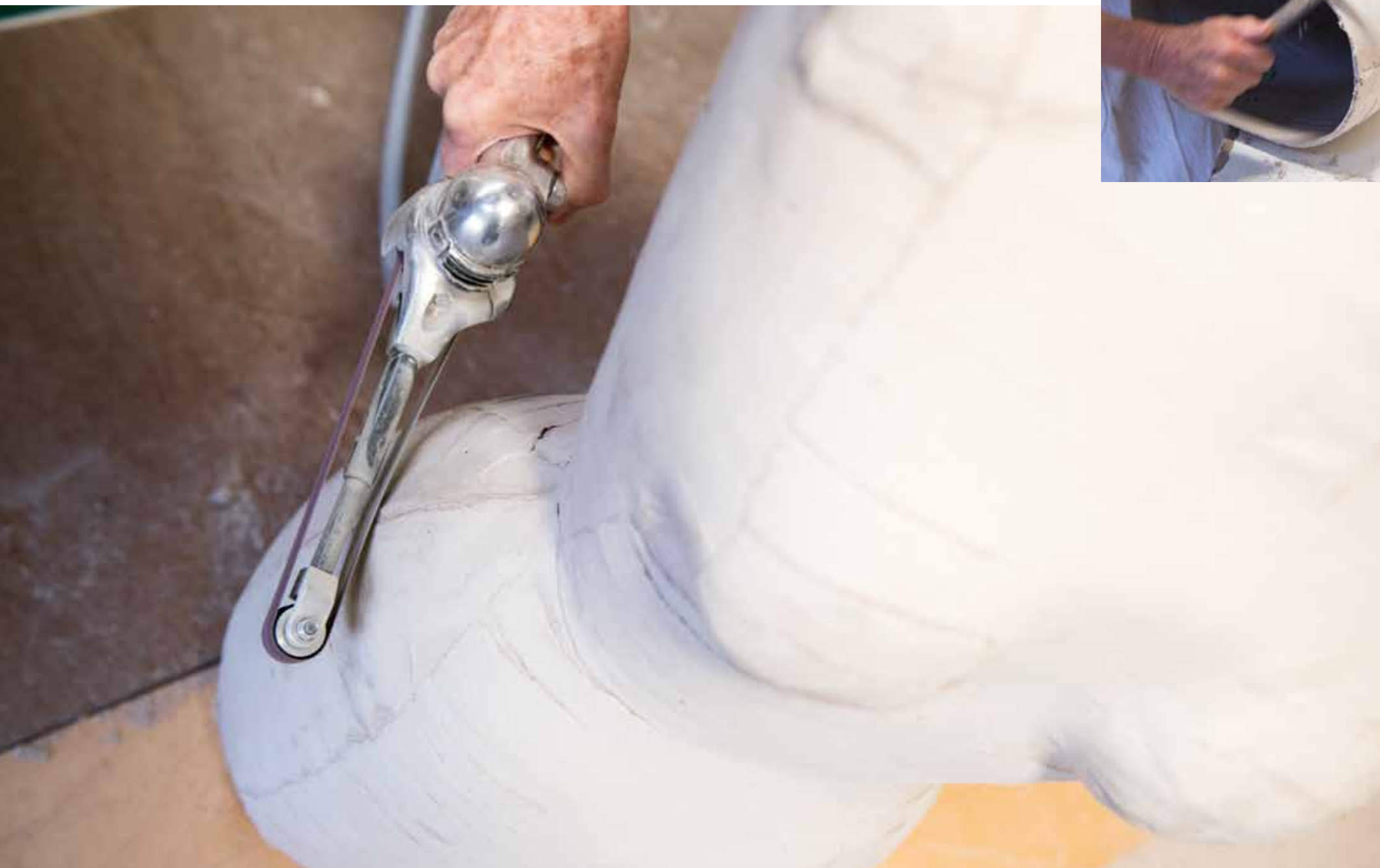
Firmenbesitzerin Marianne Burch sägt den gekennzeichneten Abschluss ab und schleift die Kanten der Büste mit einer Feile, damit sie gerade steht. Zum Schluss macht die gelernte Kauffrau den Feinschliff mit der Maschine und gleicht damit die Unebenheiten aus.